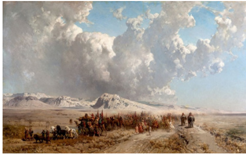
تصویر ۱۳. آلبرتو پازینی، کاروان شاه ایران، ۱۸۶۷، رنگ روغن روی بوم، ۱۳۰ × ۲۲۸ سانتیمتر، موزه شهر بوستا (URL9)

در میان تابلوهای شهری پازینی از ایران، یک تابلوی رنگ روغن به نظر حوالی مسجد سپه سالار در تهران را نشان می‌دهد و گزمه‌های سواری تهران با مشعل‌هایی در دست در حال بردن چند زندانی به محبس اند (تصویر ۱۴).