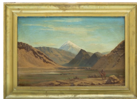
تصویر ۱۰. آلبرتو پازینی، شبهه کوه دماوند مشرف به سمت لار، ۱۸۵۶. رنگروغن روی بوم، ۵۶ × ۸۰ سانتیمتر (نگارنده، کاخ گلستان تهران)

این بدین معنی است که نقاشی اروپایی در این زمان به شدت بر تحولات تصویری در ایران تأثیر داشته است، آن‌هم نه فقط از لحاظ تکنیک نقاشی، بلکه از لحاظ انتخاب موضوع. شیفتگی به مصر در قرن نوزده در میان هنرمندان فرانسوی در دوره‌ای چنان بالا گرفته بود که امروزه تاریخ‌نگاران آن را دوره‌ی «سرمستی مصری» (اجیتومانیا) می‌نامند؛ اما کمال‌الملک بی‌آنکه دچار سرمستی مصری باشد تنها به تقلید از اروپاییان زنی مصری را در همان حال و هوای اورینتالیستی غربی نقش می‌زند (دیبا، ۱۴۰۰: ۲۱۲-۲۰۹). یکی از تابلوهای پازینی از مناظر ایران قله‌ی برف‌گرفته‌ی دماوند در مرکز تابلو در پشت کوه‌های لار قرار گرفته و شترسواری در جلوی منظره در حال گذر است. در پایین تابلو، سمت چپ، به سبک و سیاق نقاشان قاجاری، به فارسی نوشته شده «شبهه کوه دماوند مشرف به سمت لار عمل پازینی» و در گوشه‌ی راست، امضای پازینی به لاتین و تاریخ ۱۸۵۶ آمده است. اگر شترسوار این تابلو را که المانی کاملاً اورینتالیستی است حذف کنیم، با یکی از منظره‌های باربیزون‌ها روبرویم. در میان آثار کمال‌الملک نیز تابلویی مربوط به سال ۱۳۰۶ قمری در دست است که کوه دماوند را درست از همین زاویه نشان می‌دهد (تصویر ۱۰)، با این تفاوت که در این اثر خیمه‌های متعدد اردوی شاه در پای کوه، در جلوی تصویر، دیده می‌شود. در گوشه‌ی راست تابلو نوشته شده «خانه‌زاد محمد نقاش‌باشی پیشخدمت حضور همایون». این اثر سی‌وسه سال بعد از کوه دماوند پازینی خلق شده و نشان می‌دهد که حضور پازینی در ایران تأثیرات بسیاری بر نقاشان ایرانی داشته است (تصویر ۱۱).