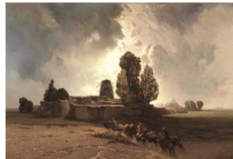
تصویر ۱۶. آلبرتو پازینی، ورود به کاروان‌سرای سلطانیه، ۱۸۵۸، رنگ‌روغن روی بوم، ۱۰۲ × ۶ سانتیمتر، کلکسیون خصوصی (URL7)

از دیگر آثار او سه تابلو از مناظر مربوط به سلطانیه‌ی زنجان‌اند. در این تابلوها هم کاروان و کاروانیان نقش پررنگی بازی می‌کنند و گنبد سلطانیه در دور دست‌گاه در میان گردوغبار به سختی دیده می‌شود (تصویر ۱۶).