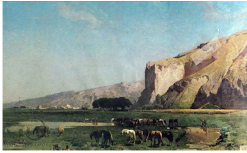
تصویر ۱۷. آلبرتو پازینی، چراگاه در مسیر تهران به تبریز، ۱۸۶۴، رنگ‌روغن روی بوم (کلکسیون خصوصی) (URL5)