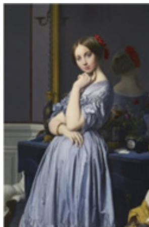
تصویر ۵. ژان دومینیک انگر، کنتس اسونویل، ۱۸۴۵، رنگ روغن روی بوم، ۹۰ × ۱۲۰ سانتیمتر،

در قلمدانی کار احمد یکی از پسران نجف اصفهانی، کنتس اروپایی در تابلوی انگر، تنها با تغییراتی در لباسش ایرانیزه شده است (تصویر ۷). در نمونه‌ی دیگری کار قلمدان نگار معروف اصفهانی، حاج حسین مصورالملکی (۱۲۶۸ ق. ۲۴/ دی ماه ۱۳۵۶ ه. ش) ۵ نشانه‌های واضحی از گرده‌برداری از این اثر دیده می‌شود (تصویر ۸). در پرده‌ای اثر حسینی امامی (پدر میرزا آقا امامی) که در کاخ گلستان است، فیگور واقع‌نمای پرده‌ی انگر، به شیوه‌ی نگارگری ایرانی به صورت دوبردی و تخت اجرا شده، به جز صورت و موها که کمی حجم دارند، با جامه‌ای یکدست لاجوردی و آذین‌های تزیینی و نیم‌تاجی بر سر (تصویر ۶). موهای طلایی کنتس فرانسوی، در اثر به رنگ سیاه شده و چهره‌ی درخشان و سرخ و سفیدش به رنگ اخراپی مات و کدر درآمده است (عزیزی، ۱۳۹۵: ۱۳۳-۱۳۴). در این پرده‌ی انگر و به‌طور کلی تر تأثیر نگاه اورینتالیستی اروپایی را می‌توان در یکی از پرده‌های کمال الملک نیز جستجو کرد. او در پرده‌ی «دختر مصری» (تصویر ۹) زنی را روبروی پرده‌ای پرچین و شکن تصویر کرده که در پشت پرده منظره‌ای وهم‌آلود و ابرآلود در دور دست دیده می‌شود. گویی کمال الملک حالت فیگور زن در پرده‌ی انگر را کمی تغییر داده و دست‌های او را بالا آورده است. بر اساس تاریخی که در پایین تابلو نوشته شده، این اثر پیش از سفر کمال الملک به اروپا کشیده شده است.