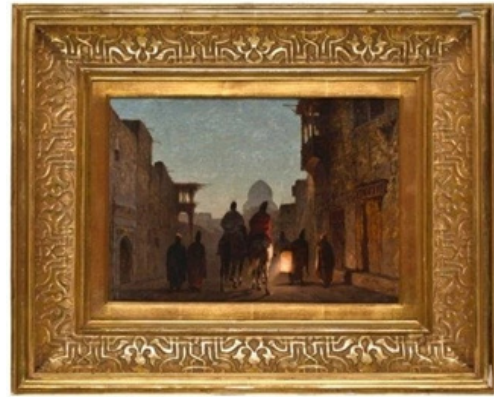
تصویر ۱۵. آلبرتو پازینی، کوچه‌ای در اصفهان، ۱۸۶۳، رنگ‌روغن روی بوم، ۲۶.۶۷×۳۵.۵۶ سانتیمتر، حراجی تاژان، پاریس (lot 274, Desember 6, 2007, Tajan Paris, Sale) (URL7)

در منابع اشاره به ورونز استاد ونیزی شده که در آثار پازینی مشاهده شده است، سبز ورونز در مناظر پردرخت او به وضوح دیده می‌شود همچنان در نامه‌ای او اشاره به رنگ سبز یاقوتی می‌کند که فقط در ایران دیده است. در آثار مربوط به سفر به استانبول که اوچ رنگ آمیزی در خشان پازینی در نقاشی‌اش به شمار می‌رود خصوصیت گفته شده واضح تر است. در نقاشی‌های پازینی از ایران او اغلب آدم‌ها را در حال شکار یا تجمع‌های عادی تصویر کرده است، او مانند سلف‌اش ژول لوران کمتر به نگاره‌های باستانی پرداخته است. حتی در اثر کمتر دیده شده‌ی «دماوند» در کاخ گلستان اگر مرکب سوار عرب (از آلمان‌های تیپیک اورینتالیست‌ها) از تابلو حذف شود نشانی از علامت‌هایی که گویای مکتبی خاص به جز واقع‌نمایی در آن باشد نیست.