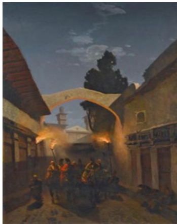
تصویر ۱۴. آلبرتو پازینی، گزمه‌های شبانه‌ی تهران، ۱۸۵۹، رنگ روغن روی تخته، ۸۷ × ۱۵۶ سانتیمتر، کلکسیون خصوصی (The painting is in private collection) (URL3)

در میان تابلوهای شهری پازینی از ایران، یک تابلوی رنگ روغن به نظر حوالی مسجد سپه سالار در تهران را نشان می‌دهد و گزمه‌های سواری تهران با مشعل‌هایی در دست در حال بردن چند زندانی به محبس اند (تصویر ۱۴).