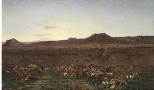
تصویر ۱. آلبرتو پازینی، کاروانی آماده‌ی سفر میانه‌ی راه شیراز و اصفهان، حدود ۱۸۶۴، رنگ‌روغن روی بوم، ۶۰×۱۰۶/۷ سانتیمتر، کلکسیون etude de burax. 1995 (URL۱۲).

در کنار کاروان و بیابان آمده است و ما تصاویری از کاروان‌های ایرانی را در کوه‌های شیراز و بیابان‌های اصفهان در حال اتراق یا حرکت می‌بینیم (تصویر ۱ و ۲).