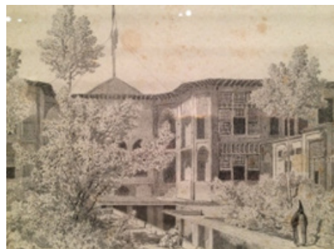
تصویر ۴. آلبرتو پازینی، یادداشت‌های ایران (۴۷ طراحی)، ۱۸۵۵-۱۸۵۶. موزه کونانیکا (URL13) museo conanica.