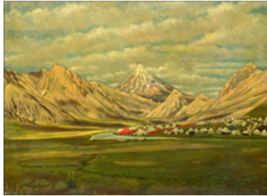
تصویر ۱۱. محمد نقاش‌باشی (کمال‌الملک)، دورنمای کوه دماوند، ۱۳۰۶ ق. رنگروغن روی بوم، ۵۹ × ۴۴ سانتیمتر، کاخ گلستان (URL2).