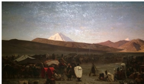
تصویر ۲. آلبرتو پازینی، توقف کاروان در ایران، ۱۸۵۹، رنگ‌روغن روی بوم، ۲۱۵×۱۰۰ سانتیمتر، حراج کریستیز، ۲۰۱۰ (URL۱۲).

پازینی در طول سفرش در ایران اغلب طراحی می‌کرده است و کمتر در فضای باز تابلوی رنگ‌روغنی کار کرده است. تنها تابلوی رنگ‌روغنی که به یقین او در زمان حضورش در ایران کار کرده، منظره‌ای از کوه دماوند است (تصویر ۱۰). این تنها اثری از اوست که در ایران به جامانده و اکنون در موزه کاخ گلستان است. در دیگر آثار او که به احتمال زیاد از روی عکس کار شده طراحی است از ورود خود و سفیر فرانسه به دروازه قزوین، در حالی که جمعیت دکاندار و فوج آدم‌های کنجکاو بر گردشان جمع شده‌اند (تصویر ۳) این طراحی به وضوح برای چشم تماشاگر غربی ساخته و پرداخته شده، از آن رو که تا قبل از او پاسکال کوست و فلاندن، یا حتی ژول لوران، با توجه به نقوش باستانی، مصداقی از زمان از دست‌رفته و ابژه پرستانه، ارزش‌های تصویری را در قالبی پیتورسک (خوش‌منظری) تصویر می‌کنند.