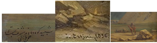
تصویر ۱۰. بخشی از تابلو دماوند پازینی از راست به چپ شترسوار، در وسط امضای پازینی به لاتین و در آخر نوشته فارسی (نگارنده)