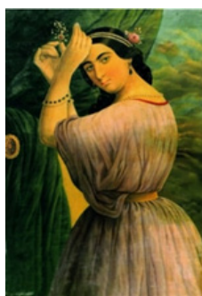
تصویر ۹. کمال الملک، دختر مصری، ۱۲۹۵ ه. ق. رنگ روغن روی بوم، ۱۰۰ × ۷۱ سانتیمتر، موزه مجلس شورای اسلامی (URL7).