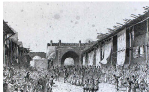
تصویر ۳. ورود دیپلمات فرانسوی و پازینی به تهران (احتمالاً از دروازه قزوین)، طراحی با مداد، ۱۸۵۸ م موزه کونانیکا (URL6).

اینکه پازینی در طی اقامت هجده ماهه که گفته می‌شود ده ماه را در دربار و در رکاب ناصرالدین شاه بوده، بر هنرمندان این دوره تأثیری داشته یا با آن‌ها در ارتباط بوده یا نه اطلاعی در دست نیست. بنا به شواهدی تازه منتشر شده از طرف فائوستو مینروینی، استاد پژوهش‌های هنری، پازینی علاوه بر طراحی زنده از عکس نیز بی‌بهره نبوده است. او با سرکشی به عکس‌های خانوادگی پازینی دریافته که او در زمان اقامت در استانبول در آتلیه عکاسی برادران عبدالله که از عکاسان معروف آنجا بوده‌اند، سه عکس از خش گرفته است. بر همین اساس احتمال اینکه چنین اتفاقی در تهران نیز افتاده باشد چندان بعید نیست. ۴