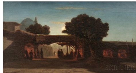
تصویر ۱۲. محله‌ای در تهران (گنبد مسجد سپه سالار در آن دیده می‌شود)، رنگ روغن روی بوم، ۱۸۵۷ م، موزه بوستون (URL4)

دسترس است تنها به نوشتن نام محل اکتفا کرده و جزئیات را به تصویر درآورده است. در حقیقت او به قدرت تصویر بیش از قدرت واژه‌ها ایمان داشته است. این همان جریانی است که به شکل روشن‌تری در نیمه‌ی دوم قرن نوزده در نقاشی اروپایی رایج می‌شود، یعنی بریدن پیوند ادیبانه از نقاشی و تاکید بر روایت تصویری. طبق قرائن تقریباً تمامی تابلوهای رنگ روغن پازینی در بازگشت به پاریس کشیده شده و بی‌شک اسکیس‌ها یا یادداشت‌های ایران به او کمک کرده تا جزئیات را دوباره در پاریس به یاد آورد و با رنگ‌های زنده روی پرده نقش زند تا آنجا که آثار تازه‌اش پس از بازگشت از سفر، تحسین محافل هنری در پاریس را برمی‌انگیزد و بسیاری او را استاد نور و رنگ می‌نامند. (تصویر ۱۲).