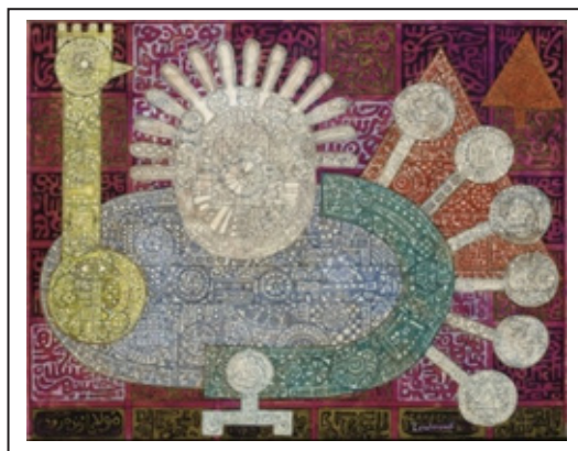
تصویر ۴- بدون عنوان، خودکار و گواش روی کاغذ، ۱۳۴۴، اثر حسین زنده‌رودی (صادقی، ۱۳۹۴: ۱۶).

حسین زنده‌رودی نقاش و چاپگر ایرانی و یکی از بنیان‌گذاران مکتب سقاخانه است. ترکیب‌بندی از پیکره‌های ساده شده یا شکل‌های هندسی در رنگ‌های ملایم که سرتاسر با علائم، اعداد و کلمات ریز پر شده از آثار اولیه اوست. چندی بعد تحت تاثیر جنبش لتریسیم ۵ در اروپا، اشکال هندسی را کنار گذاشت و صرفاً به خط‌نگاری روی آورد. در تحول بعدی کارش به منظور دستیابی به ترکیب‌بندی‌های پیچیده، سراسر کار را با انبوهی از حروف، نقطه‌ها و اعداد و یا مهر علامت‌های گوناگون می‌پوشاند و رنگ‌های درخشان را به‌طور سنجیده در درون یا لابه‌لای عناصر پخش می‌کرد (پاکباز، ۱۳۹۹: ۳۵۳).