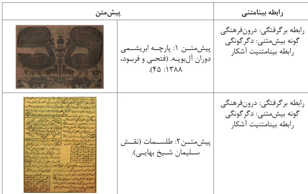
جدول ۴. گونه‌شناسی پیش‌متنهای تابلو شماره چهار اثر حسین زنده‌رودی (نگارندگان).

طاووس از دیرباز در بسیاری از آثار هنری و تاریخی ما موجود بوده است. در نقاشی زنده‌رودی طاووسی وجود دارد با دم‌گرد که برگرفته از نقش طاووس در پارچه‌های دوران گذشته از جمله قطعه پارچه‌ای از دوران آل بویه است (پیش‌متن اول). بدن طاووس روی پارچه از نقوش اسلیمی پوشیده شده و هنرمند با دگرگونی در این نقوش و تبدیل آن به نقش‌های هندسی، طاووس دیگری خلق کرده است. تابلو زنده‌رودی سراسر با رنگ و نقش تزیین یافته است. فضای قرار گرفتن سیمرغ در پیش‌متن فضایی ساده و تکرنگ است که در متن اصلی به صورت رنگارنگ و با تزیینات زیاد و بهره‌گیری از نقش‌های طلسمات (پیش‌متن دوم) دیده می‌شود. زنده‌رودی با به‌کارگیری عناصری از فرهنگ ایرانی و دگرگون کردن پیش‌متن‌ها اثر زیبا و مدرنی خلق کرده است. می‌توان تغییرات پیش‌متن نسبت به پیش‌متن را به‌طور خلاصه در جدول زیر مشاهده کرد.