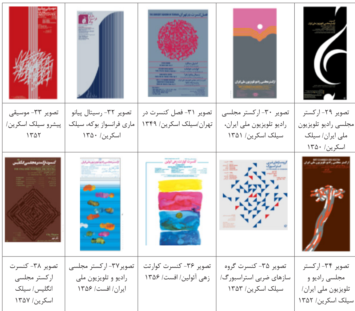
جدول ۶. پوستره‌های موسیقی دهه پنجاه قباد شیوا که با استفاده از کارکردهای خلاقانه عناصر بصری، خلق شده‌اند (نگارندگان).

(و) دسته ششم: کارکرد عناصر بصری عناصر بصری به شکلی خالص و یا در کنار خلاصه‌سازی المان‌ها و علایم موسیقی، از همان سال‌های ۴۹ تا ۵۷، در برخی آثار کارکرد یافته‌اند (جدول ۶). دو تصویر ۲۹ و ۳۰، عناصر بصری در خدمت بازنمایی از کلید سل و نیز غروب آفتاب به کار رفته‌اند. او در این باره می‌گوید، کلید سل بهانه‌ای برای طراحی چند فرم نرم در زمینه تیره بود و ایده این کار بدون اتود و به دلیل درخواست سفارش‌دهنده، به سرعت اجرا و به چاپخانه رفت. تصویر ۳۰ نیز به رغم غلبه استفاده از عناصر بصری خط، سطح، نقطه، رنگ، اما به نحوی تداعی‌گر و بازنماکننده غروب آفتاب است. اما تصاویر بعدی، همگی سعی در نفی بازنمایی و استفاده منحصر به فرد از عناصر و کیفیات بصری در جهت ادراک حسی موسیقیایی است.