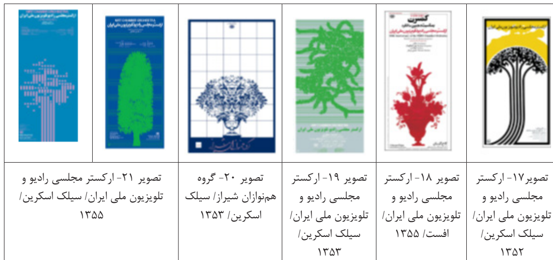
جدول ۳. پوستره‌های موسیقی دهه پنجاه قباد شیوا که در خلق آن‌ها از بازنمایی گیاه استفاده شده است (نگارندگان).

حامل و شاخه‌هایش از نت‌های موسیقی ساخته شده است (تصویر ۲۱). باید توجه داشت که نقش گیاه در ساختار تصویری نگارگری عموماً به دو شکل نمادین و تزیینی به‌کار رفته است (رفیعی‌راد، ۱۳۹۹: ۲۹). سرو درخت همیشه سبز و نمادی از بهار است، گرچه برخی آن را وابسته به ماه می‌دانند. زرتشت در اوستا به نوعی از سرو اشاره می‌کند و آن را درختی بهشتی خطاب می‌کند که برگش دانش است و برش خرد، و هر کس میوه‌اش را بچشد، جاودانه خواهد ماند. مطابق روایات، زرتشت این درخت را از بهشت آورد و در پیش آتشکده کاشت. درخت سرو به شکل‌های مختلف نمادین از جمله نماد شعله جاویدان، نماد بلندی و ایستادگی و نماد جاودانگی (قاسمیه و بمانیان و ناصحی ۱۳۹۵: ۷۹-۸۴). در نگارگری مورد استفاده قرار گرفته است. به‌کارگیری نقوش گیاه و درخت سرو در این جا، بیش از آن‌که، آهنگ رشد گیاهان را محملی برای پوستر موسیقی قرار دهد، کارکرد فرهنگی درخت و گیاه را مد نظر قرار داده است.