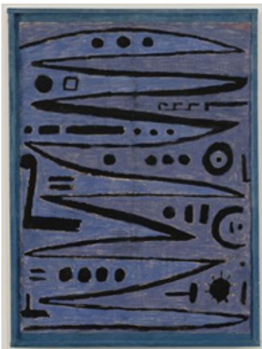
تصویر ۱- پل کله، ۱۹۳۸، نقاشی ضربات قهرمانانه کمان آرشه، ۷۳*۷۳ سانتی‌متر، خمیر رنگ‌دانه روی روزنامه که بر روی پارچه رنگ شده بر روی تخته قرار گرفته است (URL1).

جستجوی زبان اختصاصی هنر، رو به سوی فرمالیسم پیش رفت. نقاشانی مانند پل کله و کاندینسکی به‌سختی در تلاش بودند، تا مرزهای موسیقی و نقاشی را در نوردند. حس آمیزی، یکی از دغدغه‌های کاندینسکی بود و معتقد بود، بیش‌تر آلات موسیقی شخصیتی خطی دارند. یک خط کامل می‌تواند نشان‌دهنده صدای ویولا، فلوت، یا کلارینت باشد. خط کمی ضخیم‌تر می‌تواند صدای کلارینت یا ویولا باشد و خطوط پهن‌تر آلات موسیقی با صدای بم را تداعی می‌کند و در نهایت، وسیع‌ترین خطوط یادآور عمیق‌ترین صداهای تولید شده از ویلن باس پنج یا شش سیمه و توبا می‌باشد. گذشته از پهنای خطوط رنگ آن‌ها نیز شخصیت متفاوتی مانند آلات موسیقی دارند (Kandinsky, 1982: 20-50). هم‌چنین، رنگ‌شناسی او نیز با موسیقی در هم تنیده است. ویژگی رنگ زرد، رنگی که متمایل به تنالیت‌های روشن است، می‌تواند به چنان درجه‌ای از شدت برسد که برای چشم و روح غیرقابل تحمل شود. بدین طریق، رنگ زرد با شدت یافتن، هم‌چون شیپوری با صدای