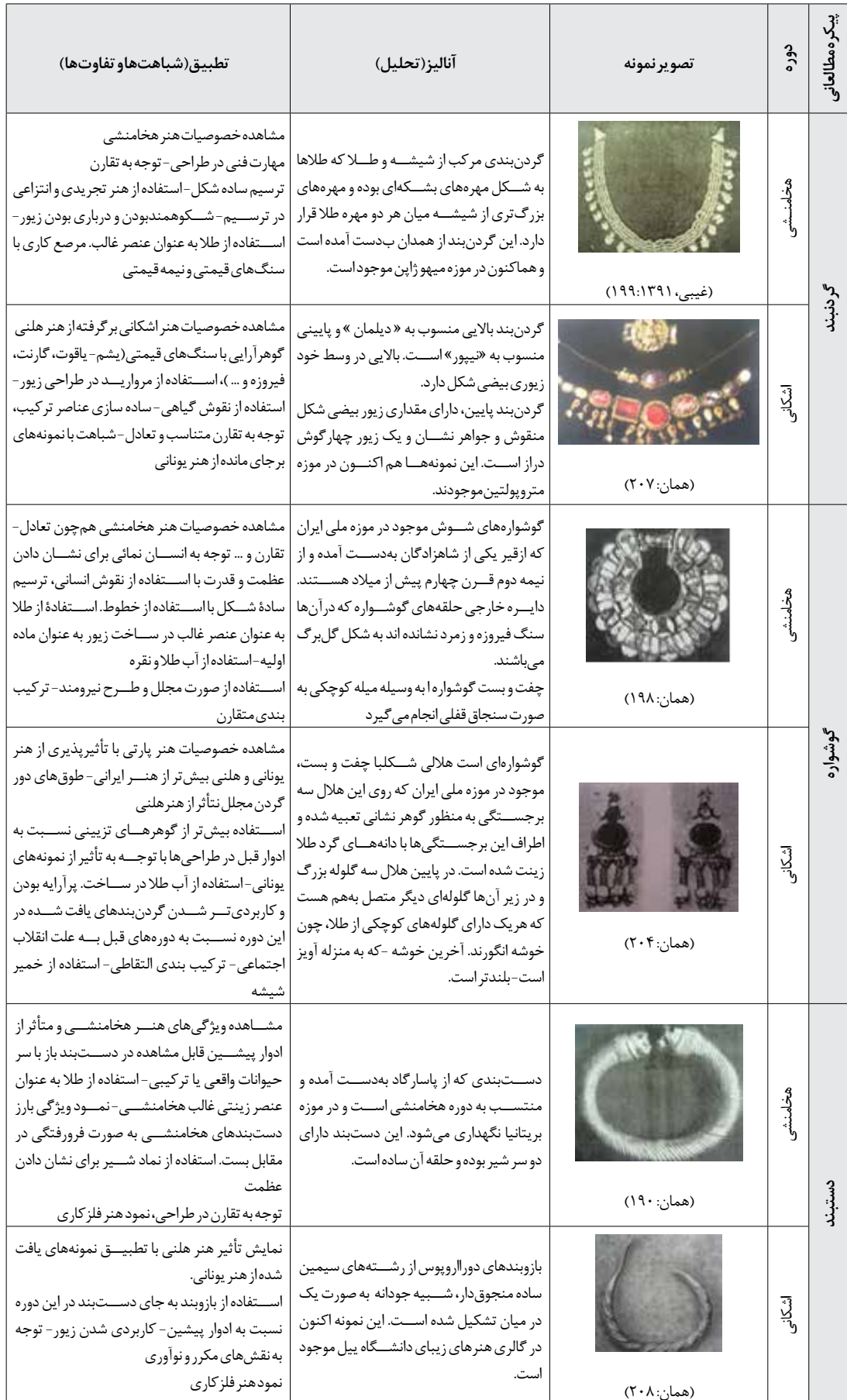
جدول ۳. پیکره مطالعاتی؛ نمونه‌هایی از آرایه‌ها و زیورات هخامنشی و اشکانی (نگارندگان).