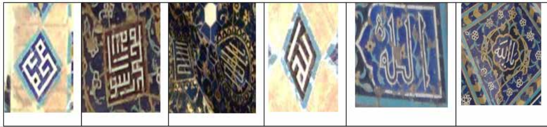
شکل ۶- انواع شکل‌های متفاوت الله و محمد (ص) در مسجد کبود (نگارندگان، ۱۳۹۸).

در قسمت‌های مختلف مسجد کبود، واژه‌های الله و محمد به صورت کتیبه‌هایی به شکل‌های متفاوت، نگاشته شده است. هم‌چنین، این دو واژه به همراه هم یا با واژه‌های دیگری به کار رفته‌اند. در نزد حروفیان الله و محمد معادل اسمای ذات بی‌مثال حضرت احدیت هستند. تعداد حروف در الله معادل اسمای ذات یعنی ۳۲ کلمه الهی و تعداد حروف در لفظ محمد (ص) معادل ۲۸ حرف در نطق محمد (ص) است (شکل ۶).