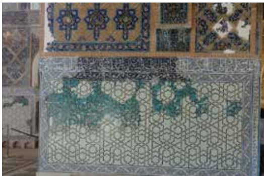
شکل ۱- آیات قرآنی در پایه‌های مسجد (نگارندگان، ۱۳۹۸)

شیوه نام‌گذاری پایه‌های مسجد بر اساس موضوعی، که آیات قرآنی در آن به کار رفته، مشخص کرده‌اند. در برخی موارد، چند کلمه نخست آیه آمده است و در برخی بر اساس مضمون آیات، نام‌گذاری انجام شده است. ۸ پایه با نامه‌ای (الف توکل، ب الحمد لله، ج سبحان الله، د رسالت، ه سلام، و توحید، ز دعا، شناخته می‌شوند و پایه هشتم، که هنوز آیات آن مشخص نیست (حسینیپور میزاب، ۱۳۸۹: ۹۸).