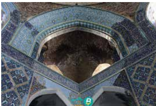
شکل ۲- بخشی از آیات سوره کهف (نگارندگان، ۱۳۹۸)

(۲) کتیبه‌های محراب: از ابتدای محراب شروع شده و پس از چرخش در اضلاع پیشانی با دعای ختم قرآن دوباره به محراب ختم می‌شود (شکل ۲). مهم‌ترین کتیبه این بخش، کل آیات سوره کهف را بر خود دارد که در مبحث افکار