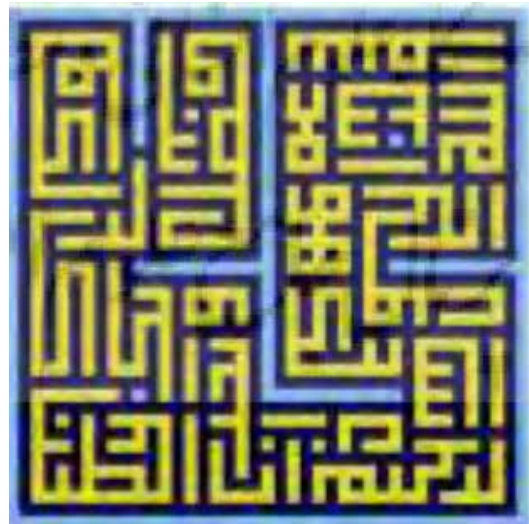
شکل ۱۲- بازسازی کتیبه بنایی متداخل در محل گنبد خانه مسجد کبود. محمد (ص) و سوره کوثر (نعمتی بابای لو و مطمئن، ۱۳۹۸: ۱۰۵).

«سوره کوثر» در قسمت محراب مسجد، در میان صحن و شاه نشین در داخل کلمه محمد به خط کوفی بنایی به اجرا درآمده است (نعمتی بابای لو و مطمئن، ۱۳۹۸: ۱۰۶). نسیمی هم چنین، لب انسان را به سوره کوثر و موی او را به سوره لیل تشبیه می‌کند (شکل ۱۲).