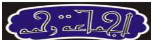
شکل ۹- واژه الجماعه (نعمتی بابای لو و مطمئن، ۱۳۹۸: ۱۰۶).