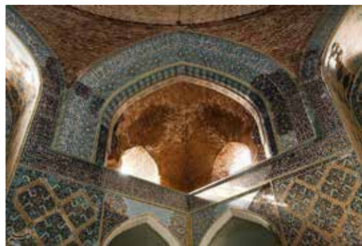
شکل ۸- بخشی از کتیبه قرآنی سوره کهف (حسینی نیا و همکاران، ۱۳۹۵: ۶).