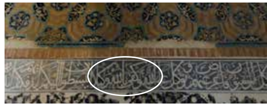
شکل ۵- قسمتی از «آیه قُلْ كَفَىٰ بِاللَّهِ يَاقُوتُكُلِّ، سوره نساء آیه ۸۱ (نگارندگان، ۱۳۹۸).

در بعضی از نوشته‌های نسیمی این واژه قرآنی به کار رفته، که