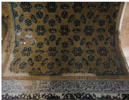
شکل ۱۱- بخشی از اسماء الهی در کتیبه های مسجد کبود (نگارندگان، ۱۳۹۸).

است. اگر خداوند چنین نام و صفاتی را برای خود در نظر نگرفته بود، شناختش غیرممکن می شد. ۱۱