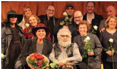
تصویر ۵- استفاده از گل در پایان تئاتر و نقش‌بندی تدریجی آن بر لباس بازیگران (Moller, 2005: 17).

سبک پوشش بازیگران تئاتر آلمانی، با توجه به پشت سر گذاشتن جنگ، تا حدود زیادی متأثر از آن بوده است. این تأثیرگذاری شامل انتخاب رنگ، جنس و نوع طراحی لباس می‌باشد. به عنوان نمونه، در این دهه‌ها، روی برخی از لباس‌های تئاتر، تصویری از گل نقش می‌بست که نشانه قدردانی از سربازان آلمانی بود. در واقع، در دوره‌های اولیه پس از جنگ جهانی دوم، اغلب مردم سعی می‌کردند به نوعی از تلاش‌های سربازان تشکر کنند. هم‌چنین، «در برخی از فیلم‌هایی که در دوران اولیه پس از جنگ ساخته شد، بازیگران می‌کوشیدند با استفاده از تقدیم گل به سربازان، قدردانی خود را از آن‌ها به عمل آورند. این مساله، در پوشش بازیگران تئاتری نیز استفاده شد؛ با این تفاوت که آن‌ها، به جای کاربرد گل در صحنه، آن را روی پوشش خود به کار می‌بردند» (Richen, 2014: 23). اگرچه در گوشه‌هایی از صحنه تئاتر نیز برخی از بازیگران تئاتر، در پایان بازی با تقدیم گل به سربازان، این وظیفه را انجام می‌دادند (تصویر ۵)؛ اما در اصل، این عمل بیش‌تر از طریق ایجاد پوشش روی لباس بازیگران، ظهور می‌یافت. در مجموع، فلسفه چنین طراحی روی لباس بازیگران تئاتر، قدردانی از فعالیت‌های سربازان بوده که در اغلب تئاترها، حتی در آن دسته از تئاترهایی که با موضوعاتی غیر از مقاومت، دفاع، جنگ و ... ساخته می‌شد، کاربرد داشت و بنابراین، مردم آلمان به راحتی این مساله، را درک می‌کردند.