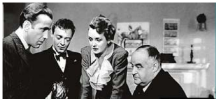
تصویر ۱۴- زن در تئاتر با پوشش از قبل از پایان جنگ جهانی دوم (Moller, 2005: 46).

تصویر ۱۴، نشان می‌دهد که چگونه یک زن در صحنه پشت تئاتر، پوششی کامل دارد و همین پوشش را نیز در صحنه اصلی ارائه می‌نماید. در هر دو تصویر، نحوه پوشش آزادانه‌تر بازیگران تئاتر در دهه‌های پس از جنگ جهانی دوم کاملاً واضح است؛ و این یک تغییر اساسی در نحوه لباس در میان بازیگران زن تئاتر در آلمان پس از جنگ جهانی دوم است. تصویر ۱۵، وضعیت مشابهی را در یک صحنه تئاتر در دوره قبل از جنگ جهانی به تصویر کشیده است. در این دوره، به تدریج، آثار ناشی از جنگ رو به فراموشی می‌گذارد و مولفه‌های دیگری مطرح می‌شود که خود را در پوشش نیز نمایان می‌سازد.