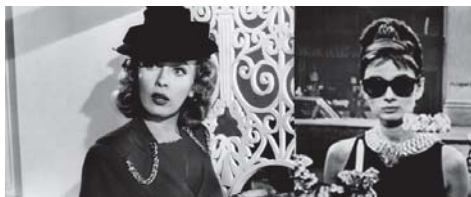
تصویر ۱۰- سبک پوشش آزادانه زنان پس از جنگ جهانی دوم (Moller, 2005: 46).