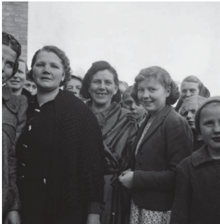
تصویر ۱- لباس مردان و زنان در حین جنگ جهانی دوم (Tolen, 2016: 15).

گفت که جریان جامعه، طراحان را به سمت این سلیقه‌های خاص سوق می‌داده است.