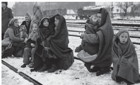
تصویر ۲: لباس مردم پیش از جنگ جهانی دوم در آلمان (Richen, 2014: 27)