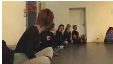
تصویر ۴- پوشش یک‌دست بازیگران تئاتر در مرحله تمرین (Richen, 2014: 40).

داشت. در حالی که پس از جنگ جهانی دوم، سبک‌های نسبتاً متفاوت و گاه، متعارضی در آلمان تشکیل شد. در این زمان گروه‌های مختلف تئاتری در آلمان تلاش می‌کردند تا آسیب‌های ناشی از جنگ را برای مردم به تصویر بکشند (Tolen, 2016: 13).