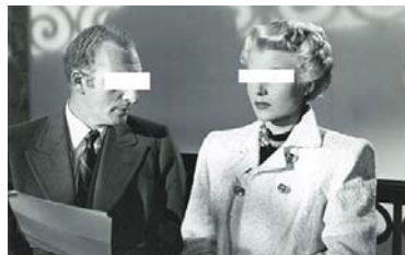
تصویر ۱۵- زن آلمانی در صحنه تئاتر قبل از پایان جنگ جهانی دوم (Moller, 2005: 47).

سرانجام آخرین تغییری که بر اساس دیدگاه بورديو در سبک پوشش بازیگران عرصه تئاتر در آلمان پس از جنگ جهانی دوم رخ داده و منجر به بروز تغییر در سبک پوشش در ایالت‌های استانی آلمان شده، مربوط به نقش و نگاری است که در پوشش به کار می‌رفته است. به طوری که در برخی از ایالت‌های آلمان پس از جنگ جهانی دوم، تغییرات زیادی در نقش لباس‌ها صورت گرفت و بازیگران و به ویژه، زنان می‌کوشیدند در پوشش خود از لباس‌های تزئینی‌تر و با جلوه‌های خاص‌تر استفاده کنند؛ در حالی که در گذشته، لباس مردان به صورت ساده و لباس زنان به صورت یک‌پارچه و بدون نقش و نگار بوده است (بورديو، ۱۳۸۱: ۴۶).