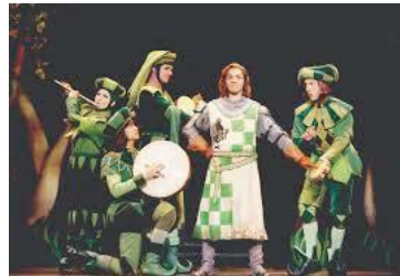
تصویر ۱۶- بازیگران تئاتر در حال نمایش (Moller, 2005: 47).

نکته اساسی آن است که، اکثر موضوعاتی که در آن‌ها، لباس‌ها دارای نقش و نگار متفاوت و متعددند، محتوایی متعلق به مبارزه و جنگ دارند؛ در حالی که در زمان جنگ، لباس سربازان ساده بوده است. این مساله به این معنا است که، بازیگران تئاتر علی‌رغم ایفای نقش سربازان، از پوشش‌های ساده خودداری کرده و اغلب از پوشش‌های با نقوش پیچیده بهره می‌گیرند (تصویر ۱۶). با این وجود، می‌توان به تئاترهای دیگری اشاره کرد که در برخی از ایالت‌های آلمان در رابطه با موضوعاتی غیر از جنگ و مقاومت ارائه می‌شد و با این وجود، در آن‌ها کوشش می‌شد تا از لباس‌های رنگی، پرنقش و نگار و جذاب استفاده شود. در این ایالت‌ها، تغییر سبک پوشش از ساده به پیچیده، کاملاً آشکار و عمدانه بوده؛ زیرا تصور بر این بود که، این رنگ‌ها می‌تواند بر جذابیت صحنه تئاتر بیافزاید. تصویر ۱۷، نمایی از صحنه تئاتر را در ایالت کلن آلمان به نمایش می‌گذارد که در آن، هر یک از بازیگران پوشش متنوع و پر از نقشی را برای بازی بر روی صحنه انتخاب کرده‌اند. به اعتقاد بورديو، این انتخاب، همواره عمدانه نیست؛ بلکه گاهی، بر اساس تغییراتی است که در جامعه کلان رخ داده باشد. همچنین، در جامعه آلمان و به ویژه پس از جنگ، تمرکز اغلب نهادها بر بهبود روحیه مردم و دوری آن‌ها از حال و هوای جنگ بوده است. صحنه تئاتر نیز به‌عنوان عنصری که همواره با مردم رابطه مستقیمی برقرار می‌سازد، از این قاعده مستثنی نبوده است؛ به طوری که در اغلب نمایش‌های مربوط به دهه‌های پس از جنگ جهانی دوم، تغییرات محسوسه‌ای از لحاظ سبک پوشش رخ داده است.