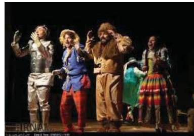
تصویر ۱۷- بازیگران تئاتر در حال نمایش (Ibid).