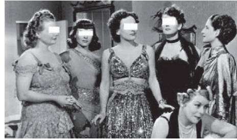
تصویر ۱۱- سبک پوشش آزادانه زنان پس از جنگ جهانی دوم (Moller, 2005: 46).

تصویر ۱۱، مربوط به یک تئاتر گروهی است که در آن، شش هنرمند به صورت هم‌زمان حضور دارند. در پوشش زنان مشاهده می‌گردد که آنان پوشش آزادانه‌تری را به نمایش گذاشته‌اند. این در حالی است که، زنان پیش از این در عرصه تئاتر یا خارج از آن از لباس‌های پوشیده‌تری استفاده می‌کردند. به طوری که بخش‌های زیادی از بدن آنان را در بر می‌گرفت. تصویر ۱۲، حضور یک زن را در صحنه اصلی تئاتر نشان می‌دهد. در این تصویر، وی با پوشش و لباس نسبتاً کامل در صحنه ظاهر شده است. در تصویر ۱۳، تصویر زنی مشاهده می‌گردد که در صحنه تئاتر در حال گفتگو با شخص دیگری است. در این جا، این زن با پوشش نسبتاً کامل ظاهر شده است. این تصاویر می‌توانند نشان دهند که چگونه در یک دوره زمانی نسبتاً اندک، یعنی تنها یکی دو دهه پس از جنگ جهانی دوم، تغییرات وسیعی در سبک پوشش بازیگران عرصه تئاتر رخ داده است.