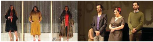
تصویر ۷- تنوع رنگ در لباس بازیگران تئاتر (Moller, 2005: 18).

رنگ‌های خاصی در تئاتر استفاده می‌شد که اغلب بدون تنوع بود (Richen, 2014: 41).