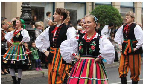
تصویر ۹- تئاتر خیابانی در آلمان در دهه‌های پس از جنگ جهانی دوم (Ibid: 44).

جنبه دیگر از سبک پوشش لباس بازیگران تئاتر، نقوش به کار رفته روی لباس آنان بود. مشاهده می‌شود که، لباس زنان بازیگر عرصه تئاتر، نسبت به پیش از این دوره، نقوش متفاوتی را تجربه نمودند. این تغییر در لباس مردان نیز تا حدودی دیده می‌شود؛ اگرچه میزان تغییر مذکور در لباس زنان بیش‌تر می‌باشد. در واقع، پس از دوره جنگ، تلاش شد تا با افزودن نقوش روی لباس بازیگران، جذابیت ظاهری بیش‌تری در عرصه نمایش رخ دهد و این مساله، غالباً، بر اساس نظریه‌های جامعه‌شناسی قابل توجیه است؛ این نظریه‌ها چنین عنوان می‌سازند که اتفاقات اجتماعی، گاهی، به‌صورت ناخودآگاه و غیرمستقیم بر افراد جامعه تاثیر می‌گذارند؛ و این امر، ممکن است در نتیجه تاثیرگذاری مستقیم اما آگاهانه این حوادث بر نهادهای یک جامعه باشد؛ براساس این نظریات، مثلاً، نهادی نظیر خانه تئاتر هنرمندان، این اندیشه و ایده را در میان کارکنان خویش القا نموده است که آن‌ها، می‌بایست برای فرار یا دور ساختن شهروندان و مردم خویش از نگرانی‌های وضعیت موجود، با تغییر در سبک پوشش خویش در زمان اجرا، شادی را برای آن‌ها به همراه آورند.