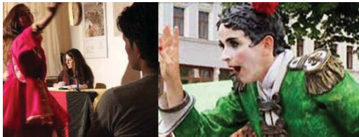
شکل ۸- تصویر تلاش بازیگران برای پوشش رنگین جهت جذب در عرصه بازیگری (Richen, 2014: 45).