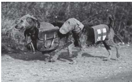
تصویر ۳- پوشش گزینشی برای حیوانات جهت استتار (Tolen, 2016: 13)

پیش از جنگ جهانی دوم، سبک پوشش اکثر افراد جامعه تقریباً با یک‌دیگر یک‌سان بود و تفاوتی از این لحاظ قابل رویت نبود. حتی گاهی، پوشش‌هایی که برای استتار حیوانات در نظر گرفته می‌شد، نیز همان پوششی بود که افراد عادی داشتند. برای مثال، حیواناتی که برای اهداف جنگی استفاده می‌شدند، با این لباس‌ها پوشانده می‌شدند (تصویر ۳). در این‌جا، سبک پوشش تنها به منظور هم‌پوشانی با طبیعت است؛ بنابراین، نمی‌توان انتظار سبک‌های خاص را