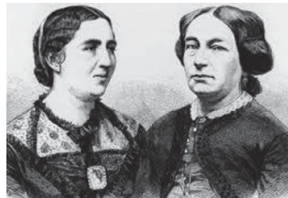
تصویر ۶- نقش گل بر لباس بازیگران پس از جنگ جهانی دوم (Moller, 2005: 17).

است (تصویر ۶). تصویری که در ادامه آمده است، مردان و زنان بازیگر تئاتری را نشان می‌دهد که روی لباس کار آنان، نقشی از گل به مفهوم نمادی سیاسی-فرهنگی نقش بسته است. این نمادها، اغلب، نقشی از فرهنگ قبلی آلمان، وقایع جنگ، قهرمانان جنگ و ... را به تصویر می‌کشیدند و کل مفهوم گل، قدردانی از جان‌فشانی‌های سربازان و کل مجموعه جنگی در جنگ جهانی دوم بوده است.