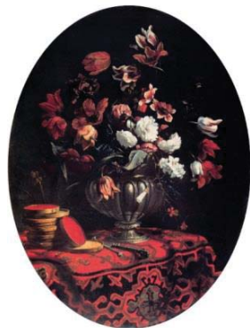
تصویر ۵- پیر فرانچسکو چیتادینی، طبیعت بی‌جان، (۲)، رنگ روغن روی بوم، بولونیا: کلیسای قدیس ماریا دی گالپرا ۴۲ (Di Prima, 2015: 240).

همان‌طور که مشاهده شد، استفاده از این نوع فرش، ابتدا در شمال ایتالیا آغاز شد و به این خاطر، هنرمندان زیادی را در این بخش، تا مدت‌ها، تحت تاثیر خود قرار داد. پیر فرانچسکو چیتادینی ۴۲ هنرمند طبیعت‌گرای قرن هفدهم میلادی است که تعداد کمی از آثارش باقی مانده‌اند و از تاریخ دقیق آن‌ها اطلاعاتی در دست نیست. یکی از نقاشی‌های این هنرمند، یک بوم بیضی شکل حاوی گلدان و سایر اجسام بر روی یک تکه فرش است (تصویر ۵). این نقاشی، احتمالاً، مربوط به دهه‌های سوم و چهارم قرن هفدهم میلادی است و در حال حاضر در یکی از کلیساهای شهر بولونیا نگهداری می‌شود. هنرمند با دقت زیادی به نمایش جزئیات پرداخته و در فرشی که نقاشی کرده، پرز آن را نیز در نظر گرفته است. این فرش از نظر طراحی با یکی از فرش‌های نوع لوتو، موجود در گالری طبیب‌نیا در میلان قابل مقایسه است (تصویر ۳)؛ و این دقیقاً آن چیزی است که ارتباط نظریه برانکاتی را با حضور فرش در نقاشی مرتبط می‌کند. همان‌گونه که قابل مشاهده است، با در دست داشتن تکه کوچکی از این فرش و بدون در نظر گرفتن محتوای آن برای هنرمند و دلیل به کار بردن آن، می‌توان نوع آن را تشخیص داد: فرش لوتو با مدل حاشیه تریبینی.