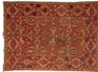
تصویر ۳- فرش لوتو، گروه تریبینی، قرن ۱۵ تا ۱۷ میلادی، میلان: گالری طبیب‌نیا (URL13).

در یک نتیجه کلی می‌توان گفت که، نقوش هندسی، که در ابتدا در حاشیه فرش وجود داشتند، ۳۹ به تدریج، جای خود را به نقوشی با منحنی‌های بیش‌تر داده‌اند و این سبک تا قرن هفدهم میلادی ادامه داشته است. آنچه که در تمام این فرش‌ها مشترک است، طرح و رنگ مرکز آن است. به‌گونه‌ای که در بسیاری از نقاشی‌های ایتالیایی قرن هفدهم میلادی، تنها قسمتی از حاشیه یا قسمتی از مرکز این فرش‌ها نمایش داده شده‌اند، اما بیننده با نگاه به آن، به‌سرعت، متوجه می‌شود که این فرش از نوع فرش لوتو است (تصویر ۴).