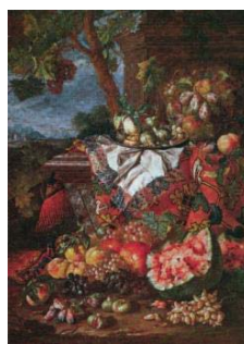
تصویر ۸- پیتر و ناوارا، طبیعت بی جان، (۴)، رنگ روغن روی بوم، بولونیا: آرشیو زری (Ibid: 243).

نقاشی‌های دیگری از طبیعت بی جان حاوی فرش از آثار پیتر و ناوارا ۴۵ موجود است که در آن از فرش‌هایی با نقوش هندسی استفاده شده است. این فرش‌ها حاشیه خاصی ندارند. اما در نقوش موجود در مرکزشان می‌توان شباهت‌هایی با نقوش فرش لوتو پیدا کرد و می‌توان اظهار کرد که هنرمند از فرش‌های لوتو الهام گرفته است. در این نقاشی‌ها، هنرمند برخلاف هم‌عصرانش، فرش را روی میز قرار نداده و برای نمایش سنگینی فرش، آن را روی ستون کوتاه سنگی قرار داده است ۴۶ (تصویر ۸ و ۹).