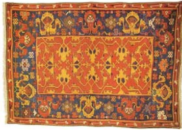
تصویر ۲- فرش لوتو، گروه آناتولی، قرن ۱۵ تا ۱۷ میلادی، نیویورک: گالری فرش متروپولیتن (URL14).

گلیم (جدول ۱ شماره ۱)؛ گروه سوم، سبک تریبینی (تصویر ۳).