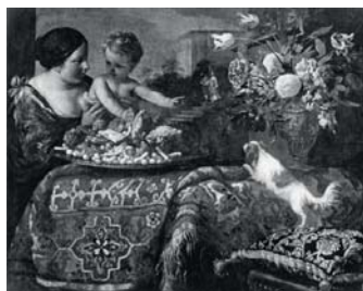
تصویر ۷- پیر فرانچسکو چیتادینی، زن جوان همراه کودک، (۴)، رنگ روغن روی بوم، بولونیا: آرشیو زری (Ibid: 241).

نقاشی‌های دیگری از طبیعت بی جان حاوی فرش از آثار پیتر و ناوارا ۴۵ موجود است که در آن از فرش‌هایی با نقوش هندسی استفاده شده است. این فرش‌ها حاشیه خاصی ندارند. اما در نقوش موجود در مرکزشان می‌توان شباهت‌هایی با نقوش فرش لوتو پیدا کرد و می‌توان اظهار کرد که هنرمند از فرش‌های لوتو الهام گرفته است. در این نقاشی‌ها، هنرمند برخلاف هم‌عصرانش، فرش را روی میز قرار نداده و برای نمایش سنگینی فرش، آن را روی ستون کوتاه سنگی قرار داده است ۴۶ (تصویر ۸ و ۹).