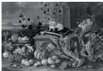
تصویر ۹- پیتر و ناوارا، طبیعت بی جان، (۴)، رنگ روغن روی بوم، بولونیا: آرشیو زری (Ibid: 244).

با آثاری که در این پژوهش ارائه شد، می‌توان به اهمیت نظریه‌های مطرح شده توسط لوکا برانکاتی و ویلیام وون بوده پی برد. با توجه به این آثار، فرش، ابتدا در آثار مذهبی ظاهر می‌شود و به‌تدریج، وارد نقاشی‌هایی با موضوعات غیر مذهبی می‌شود که این مهم می‌تواند به‌عنوان راهنمای تاریخی عمل کند. از طرفی، پی‌بردن به این‌که هنرمند به فرش واقعی رجوع کرده یا از روی نقاشی دیگری، فرشی را کپی کرده است، میزان وفاداری او به آثار اصلی در صورت وجود نمونه، نوع فرشی که در اثرش به کار برده، محل تولید آن، ترکیب‌بندی و رنگ‌های مورد استفاده همگی می‌توانند مباحثی در مقوله نقد یک نقاشی باشند که مطابق با نظریه برانکاتی است؛ و از آن‌جایی که حضور فرش در نقاشی غربی، خود به‌تنهایی، مباحثی است که جنبه‌های مختلف سیاسی، فرهنگی - اجتماعی، اقتصادی را دربر می‌گیرد، این نقد، نقدی چندجانبه می‌شود؛ که از نگاه کردن به فرش به‌عنوان یک عنصر صرفاً تزئینی فاصله زیادی می‌گیرد. با توجه به این‌که هنرمندان زیادی از این فرش‌ها استفاده کرده‌اند، قطعاً اختصاص نام آن‌ها به فرش‌های مورد استفاده‌شان - که توسط وون بوده پیشنهاد شد- می‌تواند از گمراهی محققین جلوگیری کند. در این بین، معرفی و شناخت دسته‌بندی ارائه شده توسط کورت اردمن بر پایه نظریات برانکاتی و وون بوده، می‌تواند به‌عنوان یک راهنما برای منتقد در نظر گرفته شود.