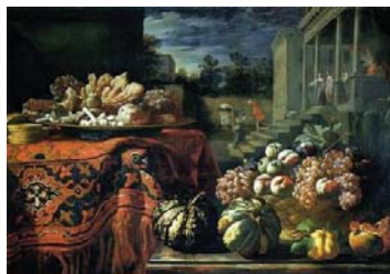
تصویر ۶- پیر فرانچسکو چیتادینی، طبیعت بی جان، (۴)، رنگ روغن روی بوم، تریسته: موزه تاریخ و هنر (Ibid: 239).