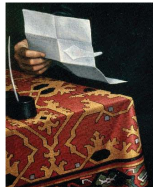
تصویر ۴- یاکوپینو دل کنته، ۴۰ چهره مرد (بخشی از اثر)، ۱۵۵۰-۱۵۶۰ میلادی، رنگ روغن روی بوم، رم: گالری اسپادا ۴۱ (URL11).

در یک نتیجه کلی می‌توان گفت که، نقوش هندسی، که در ابتدا در حاشیه فرش وجود داشتند، ۳۹ به تدریج، جای خود را به نقوشی با منحنی‌های بیش‌تر داده‌اند و این سبک تا قرن هفدهم میلادی ادامه داشته است. آنچه که در تمام این فرش‌ها مشترک است، طرح و رنگ مرکز آن است. به‌گونه‌ای که در بسیاری از نقاشی‌های ایتالیایی قرن هفدهم میلادی، تنها قسمتی از حاشیه یا قسمتی از مرکز این فرش‌ها نمایش داده شده‌اند، اما بیننده با نگاه به آن، به‌سرعت، متوجه می‌شود که این فرش از نوع فرش لوتو است (تصویر ۴).