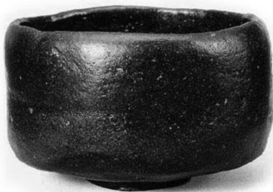
تصویر ۴

«بی‌شک این اندیشه (ناقرینگی) از سبک "یک گوشه" باین ۲۷ گرفته شده است» (پاشایی، ۱۳۷۱: ص ۱۲۹). تأثیرات این تفکر در معماری ژاپنی نمود پیدا کرده است؛ به صورتی که تجلی آن را می‌توان «به طور چشمگیری در ساختمان چای‌خانه و چای‌افزارها، همچنین در تجمع و چیدن سنگ‌های جاپا، یا سنگفرش باغ مشاهده کرد که نمونه‌های بسیاری از ناقرینگی، یا به گونه‌ای نقص و یا سبک "یک گوشه" در آن به کار رفته است» (همان، ص ۱۲۹).