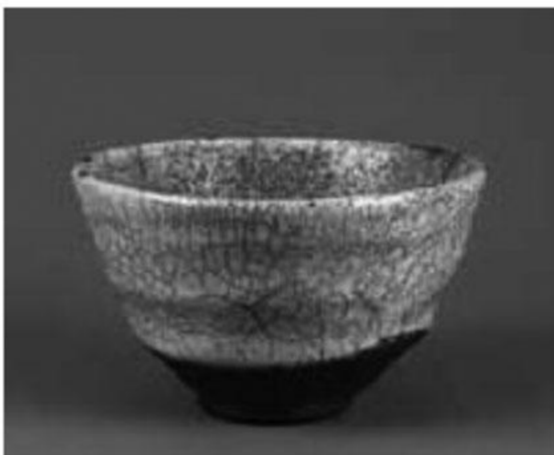
تصویر ۲ ( http://www.raku-yaki.or.jp )

«راکو را به جای چرخ سفالگری با دست می‌سازند. برای ساخت آن سنگ آتش‌زنه آسیاشده و ماسه را اغلب با خاک رس و لعاب سرب مخلوط می‌کنند. راکو در مقایسه با ظروف چینی یا سفالینه سنگی با حرارت به مراتب کمتری پخته می‌شود» (ریو، ۱۳۸۸، ص ۳۹).