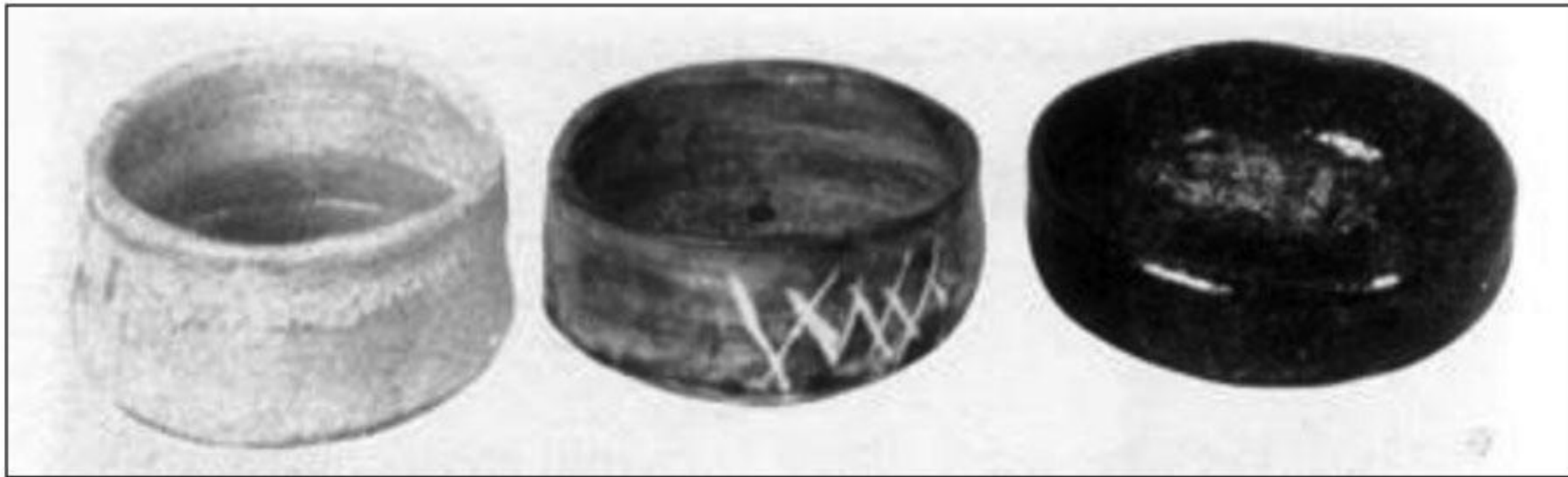
تصویر ۳: «فنجان‌های آیین چای (بالا) را در کوره‌های منطقه کن سایی می‌ساختند. این فنجان‌ها شکل‌های گوناگونی داشتند: صاف یا بلند، و رنگ لعاب آن‌ها متفاوت بود: سفید برای شینتو، نارنجی - قرمز برای راکو، و سیاه نیز رنگ پرطرفداری بوده است.» (دله، ۱۳۸۲: ص ۹۳)

و نقص‌های لعاب این ظروف، فرورفتگی ناشی از فشار ناهماهنگ دست در هنگام ساخت، بدنه ضمخت و بدون تزئینات با رنگ‌هایی ساده، آن‌ها را به اشیایی هنری تبدیل کرده است. زیرا این ویژگی‌ها نتیجه ناشیگری سفالگران نیه‌ست، بلکه نشان‌دهنده مهارت و درک بالای این هنرمندان برای ایجاد روحی مطابق با تفکرات ذن و اصول آیین چای در یک شیء بی‌جان است.