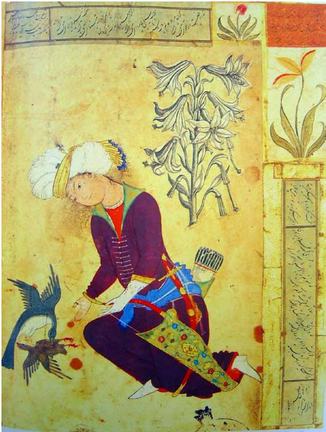
تصویر ۵: شکار و شکارچی (هنرمند نامعلوم، مرقع ۱۶۳۲، کاخ گلستان)

در ادامه این سنت، محمد زمان کاملاً به الگوی طبیعت‌نگاری اروپایی جلب می‌شود و در این مورد از سنت رضا عباسی نیز فاصله می‌گیرد. به این ترتیب، دوران جدیدی در نقاشی ایرانی به وجود می‌آید؛ دورانی که نقاشان با اتکا به سنت و آنچه از دنیای غرب به ایران می‌آمد، به آفرینش و ابداع