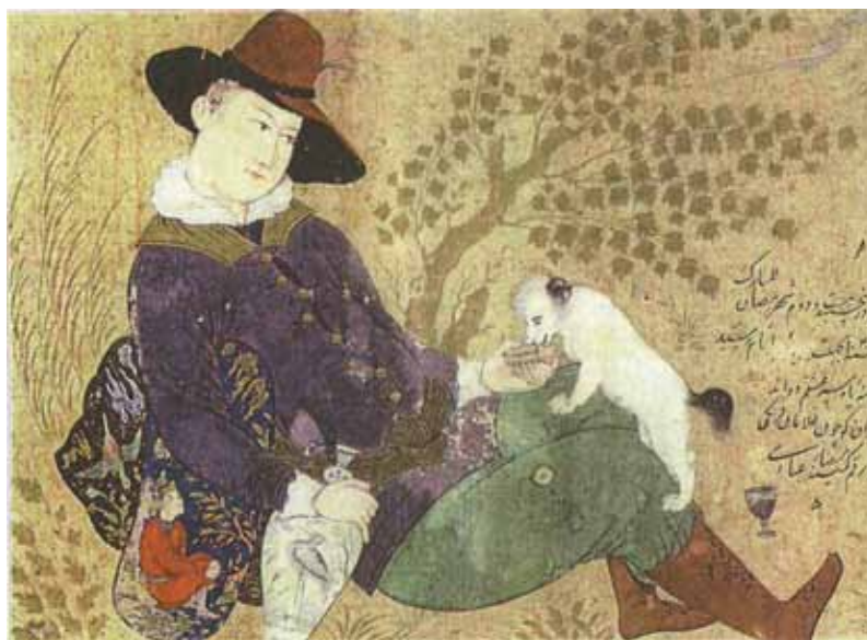
تصویر ۳: فرنگی در حال دادن شراب به سگ (اصفهان، ۱۰۳۷ هـ، رضا عباسی، آبرنگ روی کاغذ، مجموعه موريسن)

چنان از حضور و نقش آرمانی این عنصر غافل شد که اصلاً در برخی نگاره‌ها، به کلی آن را از یاد برد. در نهایت، در تک‌نگاره‌های مکتب اصفهان، نسبت بین انسان و طبیعت - که در نگارگری پیش از آن تا حد زیادی هم‌ارزش بود - به انسان ختم شد. این تغییر نگرش در بستر رویدادهایی به‌وجود آمد که حضور اروپاییان و جاذبه‌های فرهنگی ایشان در ایران از تأثیرگذارترین آن‌ها بود. سیر تحولی این نگره را می‌توان در آثار هنرمندان برجسته این مکتب دنبال کرد. هنرمندی که مکتب اصفهان با نام آن گره خورده، رضا عباسی است. چهارچوب کلی این مکتب را با وی و بر مبنای آثار او شناسایی می‌کنند. رضا عباسی دستاورد گذشتگان، به‌ویژه واقع‌گرایی بهزاد، را با سبک شخصی خود آمیخت. «او را طراحی بالفطره، با اصالتی ممتاز و با قدرت واقع‌گرایی جدیدی می‌یابیم که قلم استادانه‌اش انواع مردم عادی را که او در زندگی روزانه‌اش می‌دید، برمی‌گرفته و با خطوط مختصر تند ثبت می‌کرده است» (بینیون، ۱۳۶۷: ص ۳۸۴). در آثار و به‌ویژه تک‌نگاره‌های رضا عباسی، نقش و اهمیت انسان نسبت به عناصر و موضوع‌های دیگر بیشتر شد و طبیعت دیگر آن ماهیت آرمانی را نداشت (تصویر ۳).