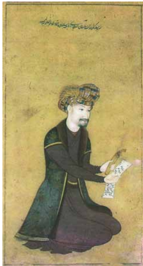
تصویر ۴: پیکر خلیفه سلطان وزیر (اصفهان، حدود ۱۰۶۰ هـ، منسوب به معین مصور)

«در مجالس او آدم‌ها معدود، بزرگ‌تر از اندازه متعارف، و غالباً بی‌ارتباط با محیط هستند. نظام رنگ‌بندی و ساختار فضا نیز در کار او بسیار ساده شده‌اند. بدین‌سان، رضا عباسی از آن قانونمندی‌های زیبایی‌شناختی دقیق و پیچیده که در خلال چند قرن تجربه حاصل شده بود، عدول کرد. در واقع، در هنر او خط بر رنگ فایق آمد» (پاکباز، ۱۳۸۰: ص ۱۲۳). با وجود این، رضا عباسی هنوز به بسیاری از اصول نگارگری کلاسیک ماقبل خود که بیشتر در کتاب‌آرایی بود، وفادار بود و آرمان‌های زیبایی‌شناسی اصیل و بومی نگارگری در آثارش غالب بود. ولی پس از وی، گرایش به غرب‌شدت پیدا کرد و «هنرمندان احساس می‌کردند که مکتب رضا عباسی جایی برای ابتکار عمل و نوآوری باقی نگذاشته است، و مانند گذشته برای الهام به سرچشمه‌های دیگری توجه کردند. تفاوت این بار در این بود که سرچشمه الهام نه چین، بلکه اروپا بود» (همان، ص ۱۱۵).