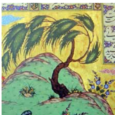
تصویر ۱: نمونه‌ای از درختان و گیاهان نقاشی شده در شاهنامه شاه تهماسب (موزه هنرهای معاصر، ۱۳۸۴)