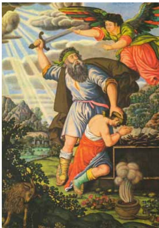
تصویر ۷: قربانی کردن حضرت ابراهیم (اصفهان، ۱۰۹۶ هـ، محمد زمان، انستیتوی مطالعات شرقی آکادمی علوم روسیه، سن پترزبورگ)

هنری دورگه دست زدند. در این دوران، نقاشی ایران «تأثیرات اروپایی را تجربه کرد. اثرپذیری از چند طریق صورت گرفت: آثار هنری اروپایی وارد شده به ایران و تماس مستقیم با نقاشان اروپایی مقیم اصفهان، نقاشیان ارمنی مقیم جلفای نو، و آثار نقاشان مکتب گورکانی هند» (پاکباز، ۱۳۸۰: