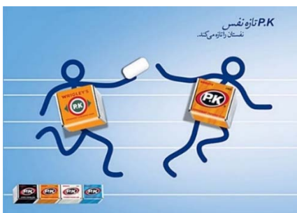
تصویر ۹: آدامس P.K، ته‌متن امینیان، ایران (www.ideyab.com)

عامل سن بر ترجیح افراد درباره تبلیغات فراواقع‌گرا نسبت به تبلیغات واقع‌گرا بررسی شد. نرم افزار مورد استفاده برای تمامی آنالیزها SPSS نسخه ۲۰ بود. سطح معناداری ۰/۰۵ در نظر گرفته شده است.