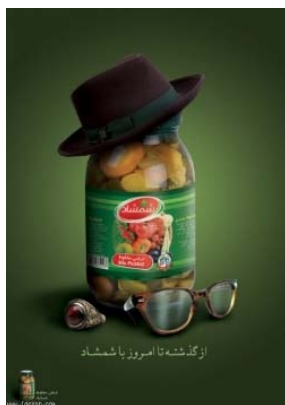
تصویر ۸: محصولات غذایی شمشاد، علی زمانی، ایران (www.ideyab.com)