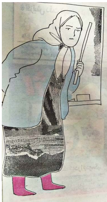
تصویر ۴- چوب معلم، مجله کیهان بچه‌ها سال ۱۳۷۹ ه.ش.

در این نمونه، اگر تصویرگر از رنگ بهره می‌برد، می‌توانست در نشان دادن هویت، به مقدار زیادی موفق باشد. چرا که داستان تصویرسازی در مورد دختری شمالی است. رنگ لباس زنان خطه شمال کشور، از جمله جذابیت‌های بومی است که تنوع رنگ‌ها، جلوه خاصی به لباس محلی زنان بخشیده است. رنگ لباس آن‌ها، طوری انتخاب شده که تضاد شدیدی با رنگ محیط داشته باشد و از فاصله دور هم در معرض دید باشد.