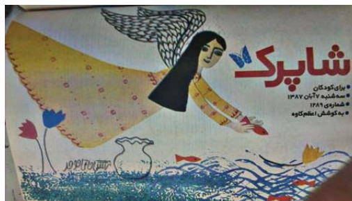
تصویر ۵- مجله کیهان بچه‌ها، سال ۱۳۸۷ ه.ش. تحلیل داستان