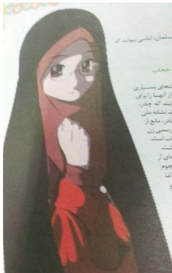
تصویر ۶- مجله کیهان بچه‌ها سال ۱۳۸۹ ه.ش.