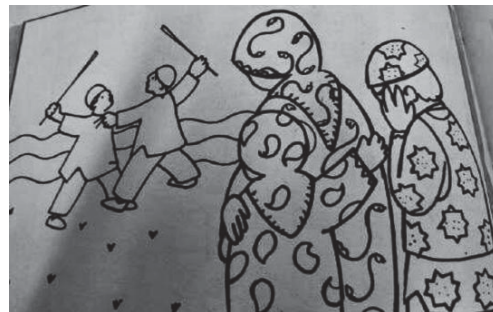
تصویر شماره ۲- سکوت، مجله کیهان بچه‌ها سال ۱۳۶۵ ه.ش.

می‌تواند عشقی باشد که بر تمام مصیبت‌ها غالب است، عشق مادرانه... مشکلات زندگی‌اش را به‌خوبی حل می‌کند و برای این‌که هیچ‌وقت، محتاج دیگران نشود، این شغل را برگزیده است. این زن روستایی، از طبقه فرودست است، که سطح رفاه‌مندی و توان اقتصادی چندان مناسبی ندارد. ناوایی از مشاغلی است که به ایستادن‌های طولانی نیاز دارد؛ با خطرات و انواع سوختگی - هنگام کار با تنور - همراه است؛ از این‌رو، بیش‌تر کاری مردانه است؛ در تصویر، این شغل برای یک زن در نظر گرفته‌شده، چیزی که ما کم‌تر در تصویرسازی‌های زنانه شاهد آن بودیم. زن روستایی، برای شوهرش نان می‌پزد؛ اما در شهر، معمولاً شوهر برای زنش از ناوایی نان می‌خرد. دختران روستایی، به مدارس روستا می‌روند و به تحصیلات پیشرفته شهری دسترسی ندارند؛ به همین علت، نمی‌توانند از نظر تکنولوژی و پیشرفت همپای آن‌ها جلو بیایند و بیش‌تر به خانه‌داری بسنده می‌کنند. این تصویر هم یک زن خانه‌دار را نمایش می‌دهد که در حال دست‌وپنجه نرم کردن با روزمرگی است. این نوع نگاه، زن خانه‌دار را موجودی منفعل، دارای حداقل دانش و توانایی، دور از جامعه و بی‌تأثیر در وقایع مهم اجتماعی، فرهنگی و سیاسی کشور و جهان، ارزیابی می‌کند. زنان روستایی، اغلب به اطلاعات و اقدامات سنتی خوداتکا می‌کنند. ارزش کار زنان در روستاها، نه تنها از کار خدماتی مردان کم‌تر نیست، بلکه در بسیاری از موارد بیش‌تر است. کار این زنان، مشکل‌تر از کارهای خدماتی زن شهری است، در کارهای خدماتی زن شهری چه در خانه و چه در خارج آن - در مقایسه با زنان روستایی، از وسایلی استفاده می‌کنند که زحمت کار آن‌ها را کم‌تر می‌سازد.