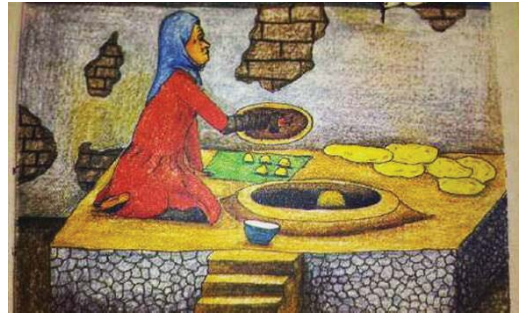
تصویر ۱- نان داغ، مجله کیهان بچه‌ها سال ۱۳۶۲، ش.

می‌شوند، کاملاً برهم نهاده و محو می‌شوند، تا رنگ‌آمیزی اثر پیوسته شود. به این ترتیب، سایه-روشن، درجات تیرگی-روشنایی و حجم‌ها شکل می‌گیرند. در اینجا، این تکنیک، هم ضعیف اجرا شده و هم کمکی به نشان دادن هویت زن نکرده است.