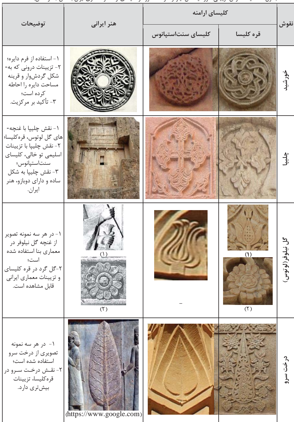
جدول ۱. مقایسه نقوش تزئینی خورشید، گل نیلوفر، درخت سرو در کلیسای ارامنه و معماری ایران باستان (نگارندگان)