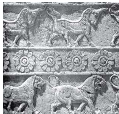
تصویر ۶- نقش گل دوازده‌پر، نقش برجسته هخامنشی (رستم بیگی، ۱۳۹۰: ۶۰).

باطراوت، نمادی از جاودانگی، زندگی طولانی و حیات پس از مرگ است (میینی و شافعی، ۱۳۹۴: ۴۷). الیاده هم در تعبیر خود از درخت، آن را به عنوان نمادی از جاودانگی عنوان می‌کند و از آن‌جا که، حیات جاودانه و بی‌مرگی را از جهت هستی‌شناسانه همان حقیقت مطلق می‌داند؛ بنابراین درخت هم نمادی از این حقیقت مطلق می‌باشد (الیاده، ۱۳۷۶: ۲۶۱). درخت سرو، سر به آسمان دارد و ریشه‌های آن، محصور در زمین است و مانند واسطه‌ای برای پیوند میان زمین و آسمان عمل می‌کند (براری و آقادی جلفایی، ۱۳۹۲: ۵۵). در واقع می‌توان گفت، درخت «محور عالم» تلقی می‌شود و «تمثیل انسانی است که ریشه در خاک دارد و هوای عروج به آسمان» و حرکت رو به تعالی (فاضلی، نیکویی و نقدی، ۱۳۹۲: ۲۲). این تفاسیر از درخت زندگی و سرو در عقاید مسیحی نیز نفوذ داشته است؛ هم‌چنان که در گذشته، درخت زندگی یا درخت کیهانی، رمز آفرینش کیهان یاد شده، در افکار مسیحی، کاج نوئل نمادی از درخت کیهانی است؛ در هنر قرون وسطایی، سلسله نسب مسیح با طرح درختی نشان داده شده است که، از صلیب یسا، پدر داود بیرون آمده است و شاخه‌های درخت، هریک توسط نیاکان او اشغال شده است و مرتفع‌ترین شاخه آن، جایگاه مریم عذرا یا حضرت مسیح (ع) می‌باشد؛ این امر، نشانه بکرزایی مریم مقدس تلقی می‌شود- (سلطانی‌نژاد، فرهمند بروجنی و ژوله، ۱۳۹۳: ۵۳).