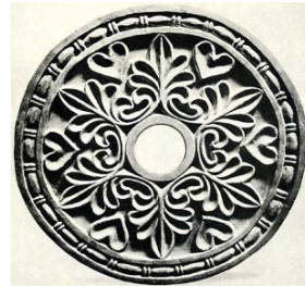
تصویر ۳- گچ‌بری کاخ تیسفون خورشید، دوره ساسانی (مبینی و شافعی، ۱۳۹۴: ۵۳).

این نقش تزیینی، از قرینگی و ریتم برخوردار است؛ برگ‌های چند پر یا کنگره‌دار آن، در مرکز به یک دایره ختم می‌شوند. نمای کلی نقش، به صورت دایره قابل مشاهده است.