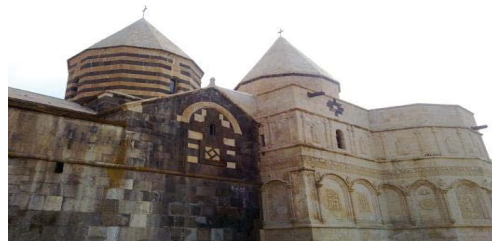
تصویر ۱- نمایی از قره کلیسا.

علاوه بر این عنوان، قره کلیسا نیز بدان اطلاق شده است؛ پژوهشگران، دو تعبیر برای این نام‌گذاری بیان داشته‌اند. برخی معتقدند که، قره در زبان آذری به معنی سیاه است و چون قسمت شرقی کلیسا با سنگ سیاه ساخته شده، از آن با نام قره کلیسا یاد کرده‌اند. برخی دیگر هم معتقدند که، قره به معنای کلان یا بزرگ است و هدف از عبارت قره کلیسا در واقع، کلیسای جامع است. تاریخ دقیق بنای کلیسا، مشخص نیست؛ اما به اعتقاد برخی مورخان، بخش شرقی کلیسا معبد مهرپرستان بوده است (ایمنی و خزایی، ۱۳۸۸: ۴۳). این کلیسا از اولین کلیساهای صدر مسیحیت است که در گذر زمان بنای آن، دست‌خوش تغییرات متعددی شده و بر اثر زلزله و عوامل طبیعی، بارها تخریب شده است. باید گفت، در اوایل قرن چهاردهم میلادی بنای کلیسا ویران گشت؛ در سال ۱۳۱۹ میلادی، عملیات بازسازی توسط اسقف زاکاریا (Zakarya)، روی قسمت قدیمی کلیسا انجام شد و مرمت آن، ده سال به طول انجامید. هم‌چنین، در دوران حکومت عباس میرزا هم تعمیراتی روی قسمت جدیدتر کلیسا صورت گرفت (همان: ۴۴).