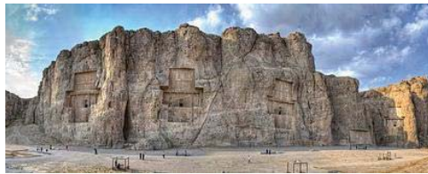
تصویر ۴- آرامگاه شاهان هخامنشی، نقش رستم ( https://fa.wikipedia.org )

چلیپا، محل ورود به درون مقبره است (کشنگر، ۱۳۹۱: ۶۷).