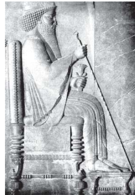
تصویر ۵- گل نیلوفر جزئی از نقش برجسته داریوش (رستم بیگی، ۱۳۹۰: ۵۹).

هخامنشی، قابل مشاهده هستند که به اهمیت و جایگاه آن در هنر ایران پرداخته شده است.