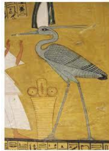
تصویر ۶- بنو.

یونان و افسانه‌های مسیحی، فونیکس خوانده می‌شود(همان: ۱۳۹). (تصویر ۷ و ۸).