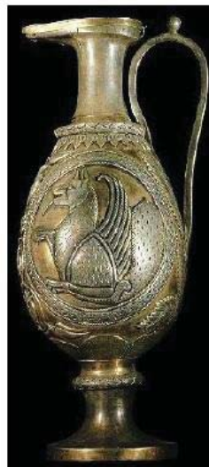
تصویر ۱- ابریق سیمین زراندود شده با نقش سیمرغ، موزه ارمنستان.

ترکیبی از اژدها و طاووس می‌دانند که زبانه آتش از دهانش فوران می‌کند (تصاویر ۱ و ۲). آثار فلزی و منسوجات ساسانی، مملو از این نقش نمادین است (گیرشمن، ۱۳۵۰: ۲۱۹). بدن و سر سگ، شیر (در برخی از موارد، دیگر چهارپایان) نماد زمین، بال‌های پرنده سمبل آسمان، پولک و فلس‌های ماهی در پوشش بدن سیمرغ، نماد آب است و در برخی موارد، آتشی نیز از دهان وی خارج شده است. به نظر می‌رسد که میان انتخاب این حیوانات برای نقش‌مایه سیمرغ و عناصر اربعه ارتباط معناداری وجود داشته باشد؛ هر یک از حیوانات نماد یکی از عناصر اربعه بوده‌اند و این موضوع، می‌تواند متأثر از نیروی جاودانگی حیات و یاری رسانندگی وی باشد که با نسبت دادن عناصر اربعه به نقش مایه وی، متجلی شده است (طاهری، ۱۳۸۸: ۱۸-۱۹).