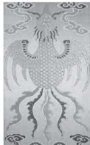
تصویر ۸- فونیکس چینی، قرن ۱۷ میلادی (Bushell, 1910: 97).

شفیعی کدکنی در تصحیح منطق‌الطیر راجع به اشتقاق ققنوس و فونیکس می‌گوید: در مصر باستان، فونیکس با عقاید مربوط به پرستش خورشید آمیخته شده است و نمادی از مرگ و زندگی و تقابل آن‌ها است. خورشید در مغرب می‌میرد و در مشرق زاده می‌شود. پس به تعبیری خورشید، همان فونیکس است(عطار نیشابوری، ۱۳۸۳: ۱۶۷). در روایات، چون مرگ فونیکس فرارسد، خود را در آتشی می‌افکند و از شراره‌های آن، فونیکس جوانی زاده می‌شود. ظاهراً میان فونیکس و ققنوس به لحاظ اشتقاق و تعبیر ارتباطی وجود ندارد (سهروردی، ۱۳۷۳: ۶۴۹). ویژگی و خصوصیات احیای مجدد و حیات دوباره و نامیرایی بین سیمرغ و فونیکس بسیار مشابه است. به همین دلیل در بسیاری از مواقع، سیمرغ و فونیکس یکی شده و در شمار زیادی از نگاره‌های ایرانی سیمرغ، ظاهر فونیکس را دارد(طاهری، ۱۳۸۸: ۱۷).