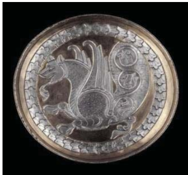
تصویر ۲- سینی دارای روکش نقره و نقش سیمرغ، قرن ۷-۸ م. (محمدی حاجی‌آبادی و پورمند، ۱۳۹۰: ۶۰).

گرفته است که در برخی موارد، این فرم بر طراحی سیمرغ نیز اثر گذاشته است. نقوش تزیینی یا هندسی دارای قابلیت تکرار است و حرکت دایره‌ای و پویایی را تشدید می‌کند که مفهوم نمادین عالم، زندگی و حیات است. سیمرغ در دایره، تمثیلی از الوهیت و نیروهای آسمانی است (همان: ۱۹-۲۳).