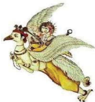
تصویر ۹- گارودا.