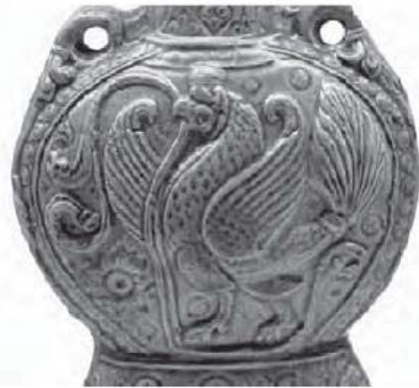
تصویر ۷- ظرف زائرن از نوع بیانهو، چین، سلسله سویی، قرن ششم و هفتم میلادی، موزه برلین. (Bushell, 1910: 135).