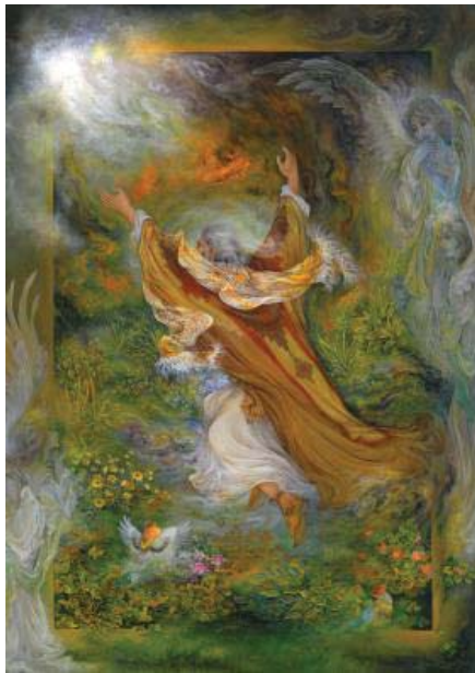
تصویر ۱- ابراهیم نبی، محمود فرشچیان

صداقت، وفاداری و اراده‌ای که در وجود حضرت ابراهیم(ع) و سیاوش متجلی شده، آن‌ها را به نمادهای خیر تبدیل کرده است. در مقابل، انعکاس ردایی نظیر شرک، بی‌اعتمادی، سرپیچی، ناپاکی، کفر، بی‌خردی، کینه، زشتی، دروغ‌گویی، خیانت و سستی اراده در نمرود و سودابه، از آن‌ها سمبل‌های شر ساخته است. در بین خیرهای اخلاقی، اراده از جایگاه ویژه‌ای برخوردار است و می‌توان گفت، محور اصلی دیگر صفات اخلاقی است. فارابی معتقد است: رسیدن به سعادت غایی یعنی تجرد از ماده با افعال ارادی ممکن است- که برخی فکری و بدنی است- اما نه با هر گونه فعلی؛ بلکه با افعال معینی که از ملکات دینی سرچشمه گرفته باشد (گنجی، ۱۳۸۶: ۱۳۹). در سیر داستان حضرت ابراهیم(ع) و سیاوش نیز اراده نقش تأثیر گذاری دارد (جدول شماره ۱).