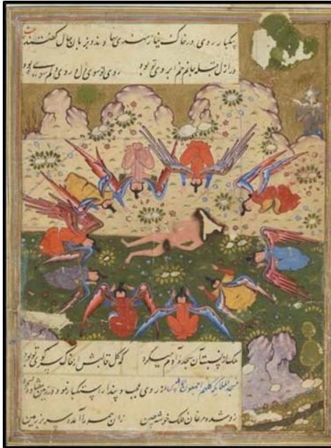
تصویر ۱: حضرت آدم برهنه بر روی زمین، مجالس العشاق، صفوی، ۱۵۶۰ م، کتابخانه ملی پاریس به شماره ۷۷۵ متمم فارسی www.gallica.bnf.fr

است درحالی که فرشتگان در حال سجده کردن در برابر او هستند. در این نگاره نگارگر نشانه‌های دیگری غیر از هاله مقدس را برای حضرت آدم در نظر گرفته است و حتی برای تأکید بیشتر نام آدم عدم را نیز در کنار تصویر حضرت آدم (ع) نوشته است. (تصویر شماره ۲)