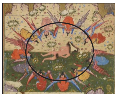
تصویر ۸: حضرت آدم (ع) در مرکز ترکیب‌بندی دایره. (بخشی از تصویر شماره ۱)

۱ - ۴- ترکیب‌بندی: از دیگر مواردی که نگارگران برای تأکید بیشتر بر جایگاه پیکره حضرت آدم در نگاره‌ها به کار بسته‌اند قرار دادن آدم (ع) در مرکز ترکیب‌بندی و کادر نگاره است. در تعداد زیادی از نگاره‌ها جایگاه حضرت آدم در مرکز توجه نگاره قرار داده شده است، حتی در مواردی که تخت آدم (ع) در میان نگاره قرار نگرفته باز چیدمان عناصر بر روی یک قوس حلزونی به گونه‌ای است که او در نقطه شروع این گردش و کانون توجه نگاره است؛ اما در بیشتر نگاره‌های این مضمون، با ترکیب‌بندی قرینه روبرو هستیم. به عنوان مثال در نگاره‌ای از قصص الانبیاء تخت حضرت آدم بر روی خط میانی نگاره قرار گرفته و فرشتگان در برابر او و در دو طرف حضرت آدم در حال سجده هستند و این موضوع باعث شده تا توجه‌ها بیشتر به سمت حضرت آدم که در میان این ترکیب‌بندی قرینه قرار گرفته جلب شود. در نگاره‌ای از مجالس العشاق آدم (ع) درست در مرکز نگاره و بر روی خطی که حدفاصل بین طبیعت سرسبز و رنگ خاکی صخره‌هاست، با بدنی عریان تصویر شده است. در این تصویر، حضرت آدم هم در مرکز نگاره قرار گرفته و هم در مرکز دایره‌ای که محیطش را فرشتگانی که بر او سجده می‌کنند تشکیل داده‌اند. (تصویر شماره ۸) ترکیب‌بندی خاص این تصویر به وضوح تمام بر مرکزیت وجود آدم تأکید نموده و برتری و محور بودن او را در خلقت هستی نشان می‌دهد.