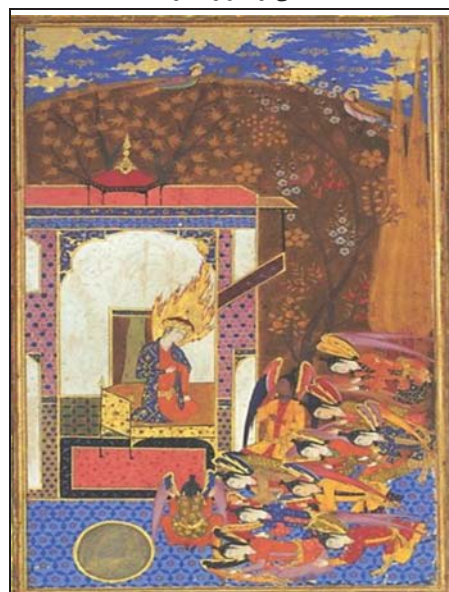
تصویر ۷: آدم (ع) نشسته بر تخت خلیفه الهی. حبیب السیر، جلد اول، ص ۲۸، اوایل سده ۱۱ ه.ق. مجموعه کاخ گلستان به شماره ۲۲۳۷ (نگارنده)

در نگاره‌ای دیگر که به حبیب السیر اختصاص دارد نیز، آدم (ع) بر تختی از زر سرخ که در بارگاهی قرار گرفته نشسته و لباس‌های فاخری بر تن دارد، علاوه بر این نگارگر از شعله مقدس نیز در اطراف سر