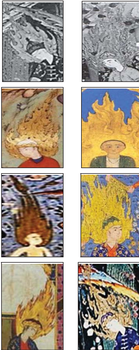
جدول ۲: شمایل حضرت آدم (ع) همراه با شعله مقدس در نگاره‌های برجای مانده از این مضمون

این بار نگارگر با نگاهی اغراق آمیز و عرفانی فضای آکنده از شعله مقدس را در اطراف حضرت آدم به تصویر کشیده است. فضایی که آدم (ع) به هنگام آفرینش و در زمانی که فرشتگان در مقابل او و برای تسبیح خداوند متعالی که اشرف مخلوقات را خلق کرده به سجده رفته‌اند. استفاده از رنگ طلایی در این