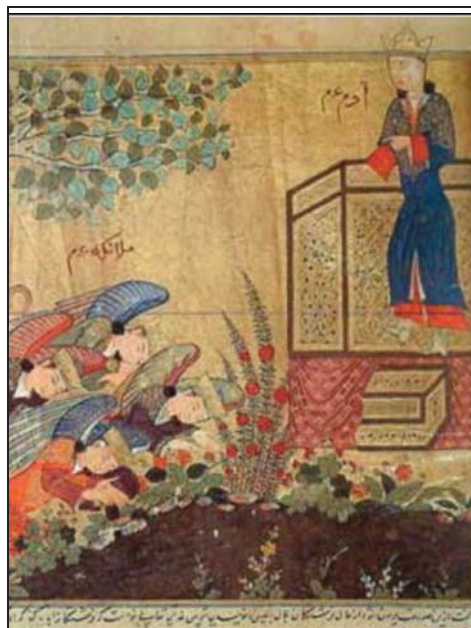
تصویر ۶: آدم (ع) با تاج و تخت خلیفه الهی. (بخشی از تصویر شماره ۲)

آدم حتی از کادر نگاره نیز بیرون زده و بالاتر قرار گرفته است و نوشتن عنوان آدم عدم در کنار پیکره او در نگاره، همه و همه از نشانه‌هایی است که برای تأکید بیشتر بر موقعیت و جایگاه آدم (ع) توسط نگارگر به کار گرفته شده است. (تصویر شماره ۶)