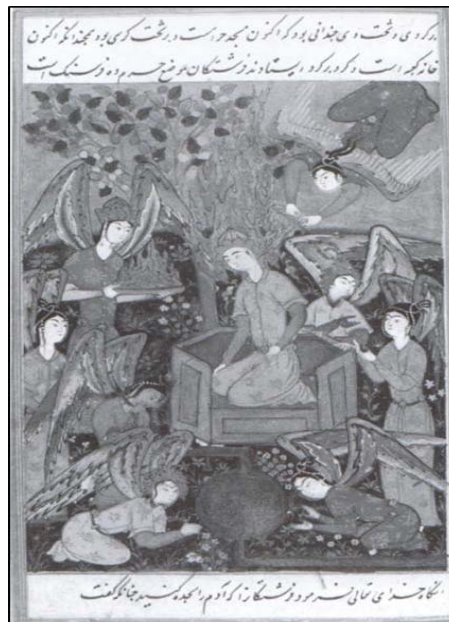
تصویر ۴: فرشته‌هایی که برای حضرت آدم شعله مقدس می‌آورند. قصص الانبیاء، صفوی، ۹۸۲ ه.ق، توپقاپی سرای، استانبول به شماره H1۲۲۷ (Milstein, 1999: 293)

۱ - ۲ - فرشته‌ها با طبق‌هایی از نور: فرشتگان پیام‌آوران بالداری هستند که میان خدایان و بشر ارتباط ایجاد می‌کنند (هال، ۱۳۸۳، ۲۶۰) می‌توان گفت تلفیق پیکر انسان با بال‌های بزرگ از دیرباز نمادی از انسان _ خدا محسوب می‌شده است و حضور فرشته‌ها در درگاه خداوند و واسطه بودن آنان میان بارگاه الهی و انسان باعث شده که فرشته‌ها در ترکیبی از پیکر انسان و بال‌های پرنده به ظهور برسند. حضور فرشته‌ها در بسیاری از نگاره‌ها تداعی‌کننده فضایی قدسی و آسمانی است بنابراین در اکثر نگاره‌هایی که مربوط به حکایت آدم (ع) و حوا است دیده می‌شوند.