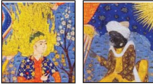
تصویر ۱۱: نمونه‌ای دیگر از تقابل سیمای جوان حضرت آدم در برابر شمایل سالخورده و تیره ابلیس. (بخشی از تصویر شماره ۵)