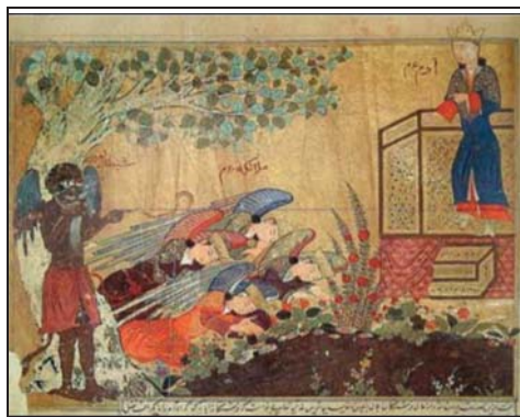
تصویر ۲: حضرت آدم (ع) با تاجی بر سر، ایستاده بر تخت خلیفه الهی، تاریخ طبری، ۱۴۱۶ م، موزه توپقاپی، استانبول B2۸۲. (Sheila R, 1990: 17)

تعداد ۸ نگاره باقیمانده که همگی به قرون ده و اوایل یازده هجری قمری اختصاص دارد، برای نشان دادن تقدس حضرت آدم، او را با شعله مقدس در اطراف سرش به تصویر درآورده‌اند که در ذیل، بخشی از این نگاره‌ها که شمایل حضرت آدم را همراه با شعله