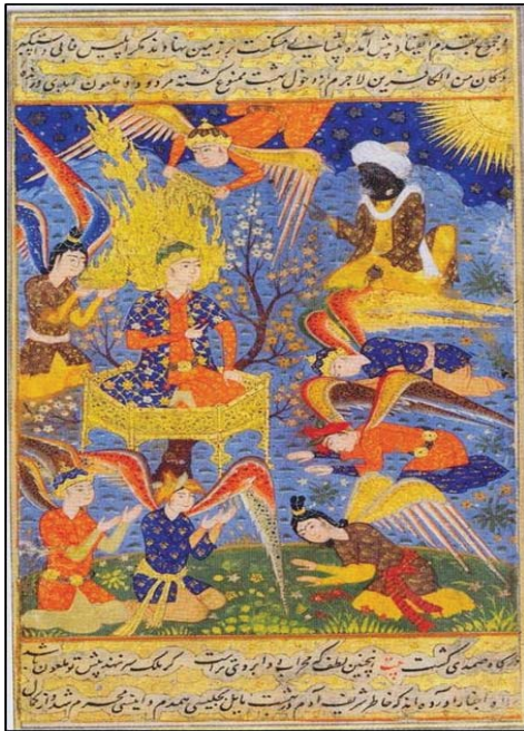
تصویر ۵: فرشته‌هایی که برای حضرت آدم شعله مقدس می‌آورند. نسخه، ۱۵۷۰ م، موزه لوور پاریس (Romani, 2008: 156)

طبق‌هایی از شعله‌های زرین به نشانه تقدس به‌نوعی اغراق در زمینه فرامادی بودن جایگاه حضرت آدم در این نگاره‌ها دارد و نشانگر پاکی و نورانیتی است که به‌عنوان موهبتی الهی بر انبیاء اهداء شده است. (تصاویر شماره ۴ و شماره ۵)